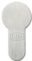
01 matt vernickelt