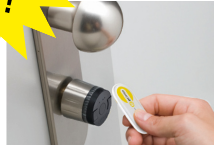
Elektronischer Zylinder e-primo air

Der elektronische Zylinder für Privathaushalte und Small Business. Neu: mit berührungsloser MIFARE-Technologie (e-primo air). Es ist kein PC, keine Software und keine Verkabelung notwendig – die Berechtigungsänderungen lassen sich unkompliziert direkt am e-primo-Zylinder durchführen. Mit dem Konfigurator auf www.evva.com/e-primo kann jeder seinen Wunsch-e-primo designen. Sofort verfügbar.