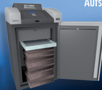
Cash Collect offen mit Auffangsack