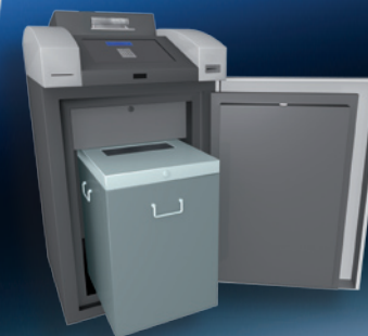
Cash Collect offen mit Auffangbox